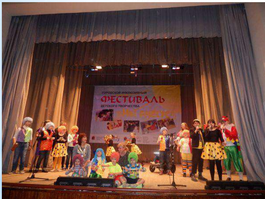
Образцовый коллектив Театр песни «Поющие гномики»

Выступление на просторах России (Москва, Санкт-Петербург, Калининград, Екатеринбург, Самара, Казань, Анапа и др.)