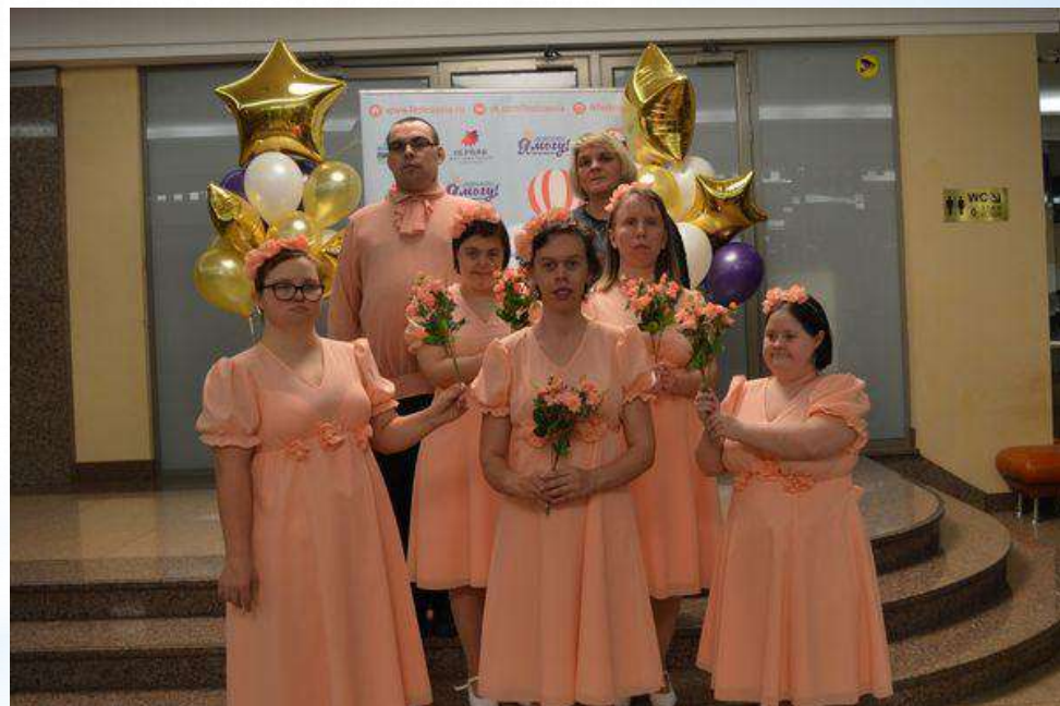
театр-студия "Улыбка", танцевальные коллективы "Непоседы", "Калейдоскоп" и "Вдохновение".